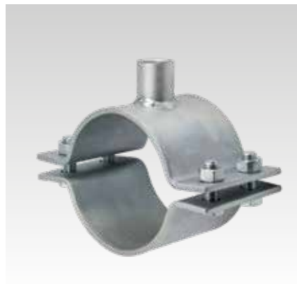
Objímka pro pevný bod 120 x 6