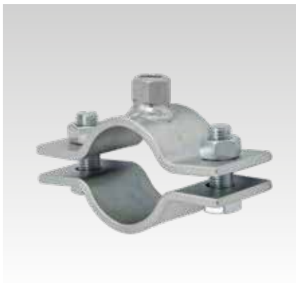
Objímka pro pevný bod 60 x 6