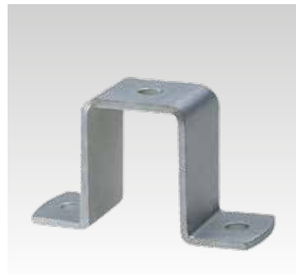
Pro profil 40/60, 40/80 a 40/120