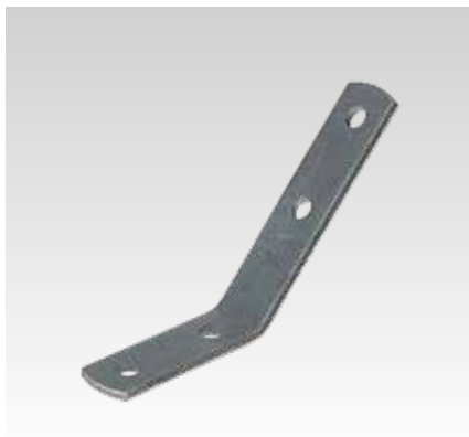
Montážní úhelník 45°