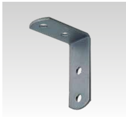
Montážní úhelník 90°